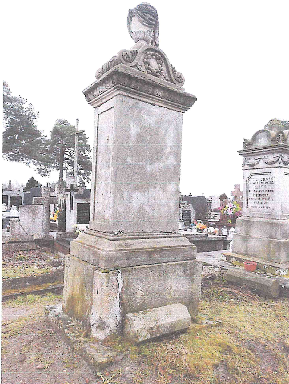
STARY SZELKÓW CMENTARZ PARAFIALNY NAGROBEK RZECHOWSKICH STAN LUTY 2023R.

WOJEWÓDZKI URZĄD OCHRONY ZABYTKÓW W WARSZAWIE Delegatura w Ostrołęce 07-400 Ostrołęka, ul. Kościuszki 16 tel./fax (029) 764-22-39