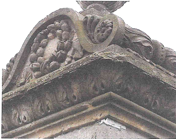
STARY SZELKÓW CMENTARZ PARAFIALNY NAGROBEK RZECHOWSKICH STAN LUTY 2023R.