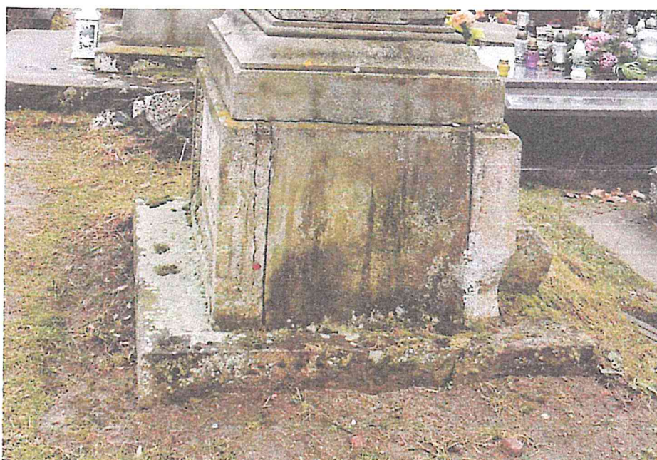
STARY SZELKÓW CMĘTARZ PARAFIALNY NAGROBEK RZECHOWSKICH STAN LUTY 2023R