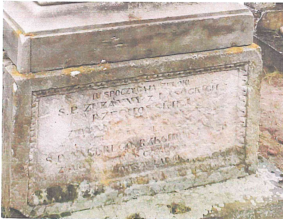
STARY SZELKÓW CMENTARZ PARAFIALNY NAGROBEK RZECHOWSKICH STAN LUTY 2023R