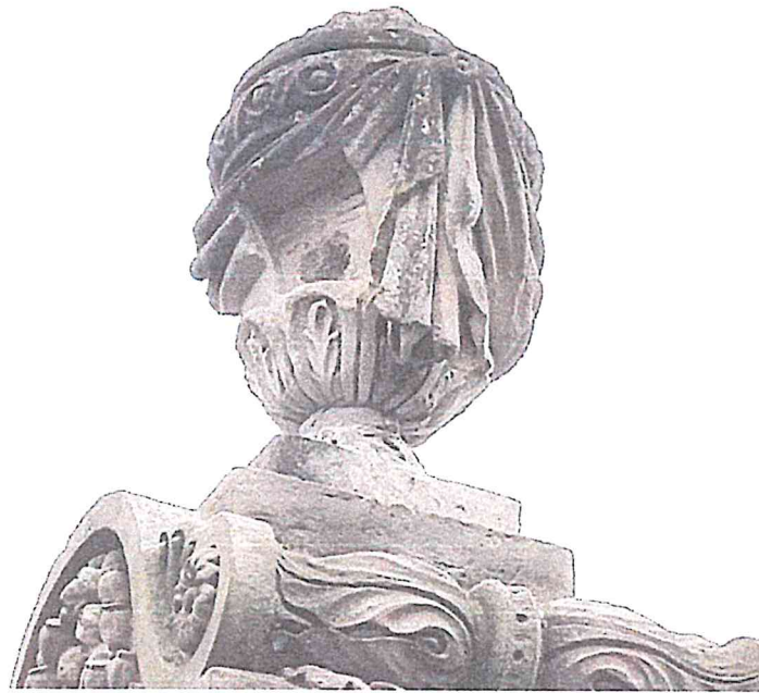
STARY SZELKÓW CMENTARZ PARAFIALNY NAGROBEK RZECHOWSKICH STAN LUTY 2023R