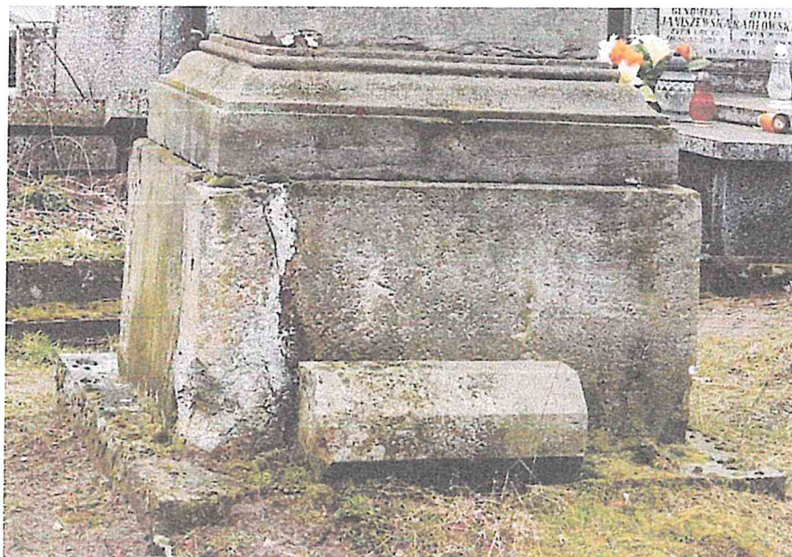
STARY SZELKÓW CMĘTARZ PARAFIALNY NAGROBEK RZECHOWSKICH STAN LUTY 2023R